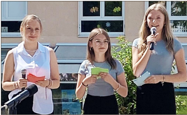
Die Schülersprecherinnen führen gekonnt durchs Programm.